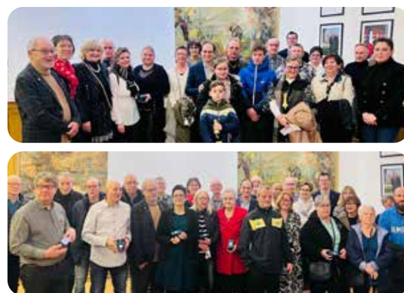
Remise des prix du Concours de Décorations et Illuminations de Noël et Cérémonie de remerciement aux personnes investis pour les Festivités de Noël à Bouzonville