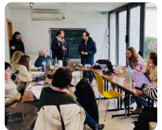
Premier atelier théâtre de la CCB3F à l'Espace Culturel