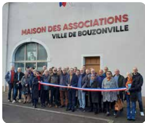
Inauguration de la Maison des Associations