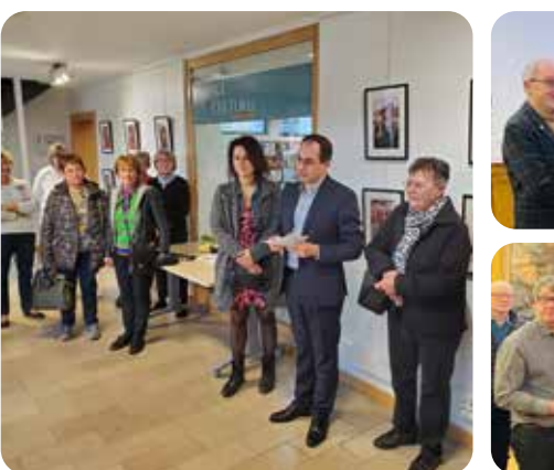
Inauguration de l'exposition « Portrait de Bouzonilloises »