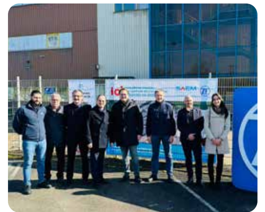
Installation d'une centrale photovoltaïque chez ZF