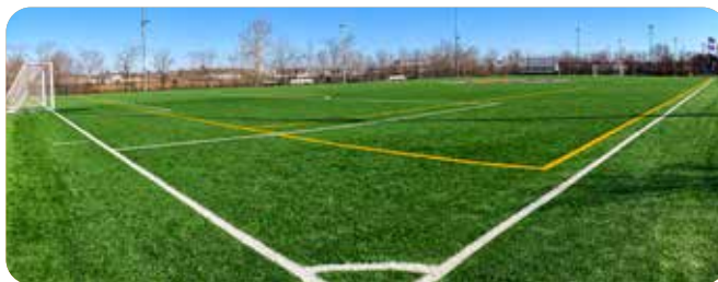
Terrain de football synthétique