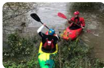
Berges de la Nied