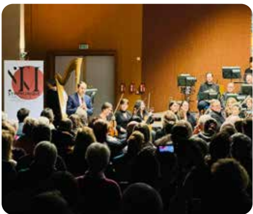
Concert du Symphonique Thionville-Metz