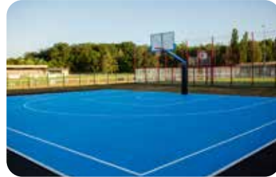
Terrain de basket 3x3