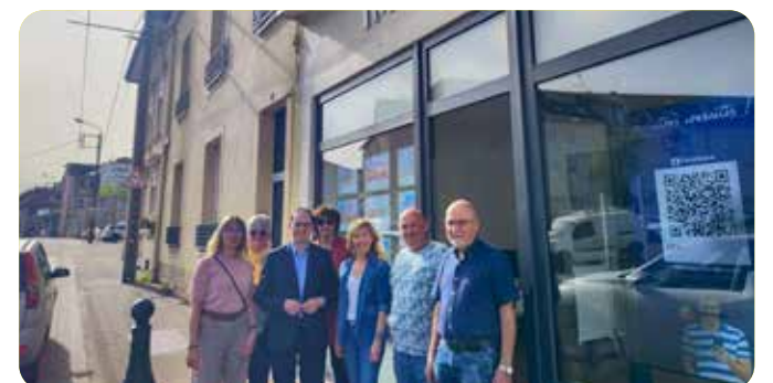
Agence immobilière Immozen Rue de France