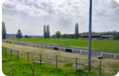
Terrain de football