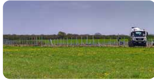
Parc de panneaux photovoltaïques