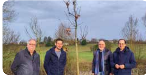
Plantations de 30 arbres