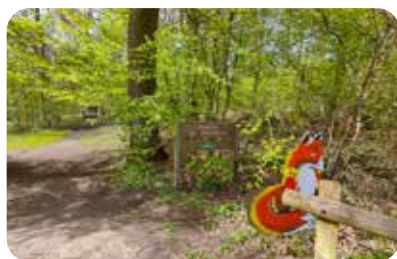
Parcours de santé