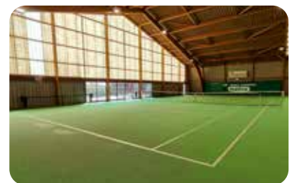
Terrains de tennis