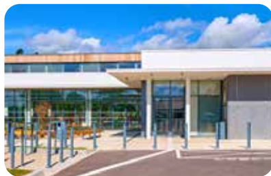
Centre aquatique CCB3F