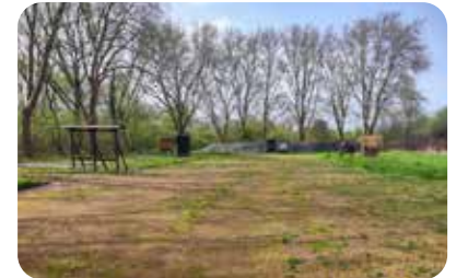
Terrain des archers