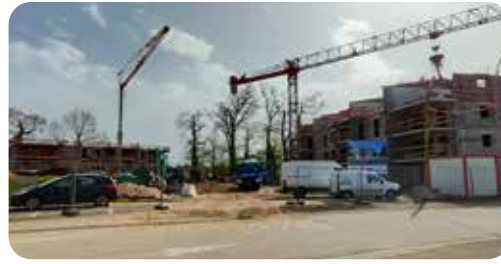
Logements au complexe sportif