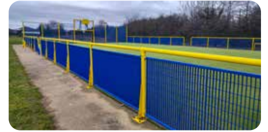
Peintures des barrières du city stade