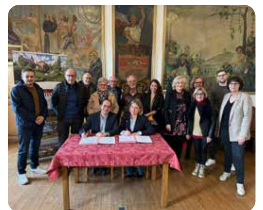
Signature d'une Convention de soutien aux Commerçants