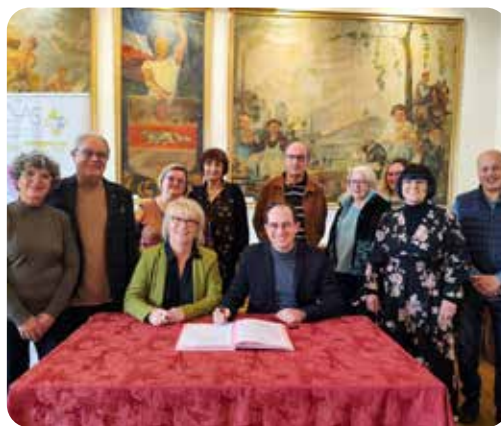
Signature d'une Convention entre le CCAS et le Département