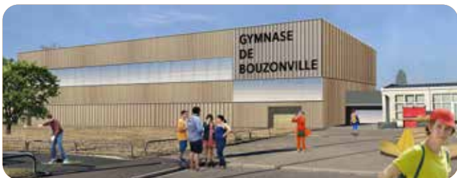
Rénovation énergétique du Gymnase