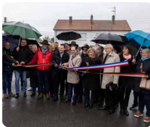
Braderie du Vendredi Saint