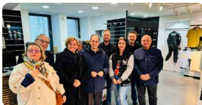
Magasin de moto MP2Wheels Rue de la République