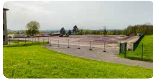
Terrain de football synthétique