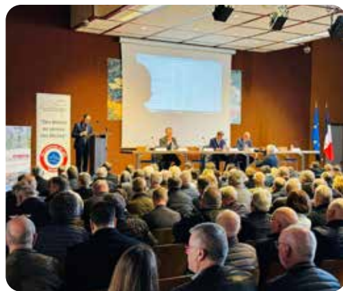
Assemblée Générale des Maires Ruraux