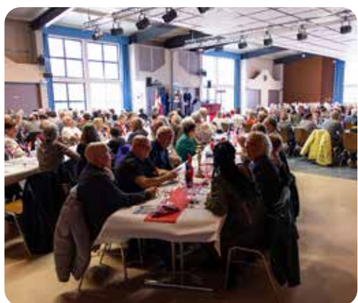
Repas des séniors