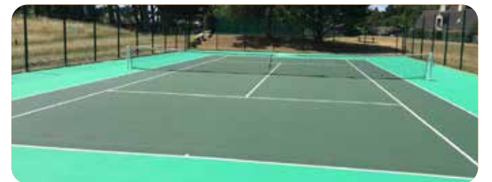
Construction de terrains de tennis Green Set