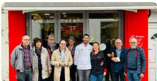
Nouvelle boulangerie Gustinati Rue de la République