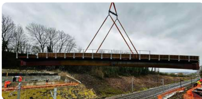
Réfection du pont d'Alzing