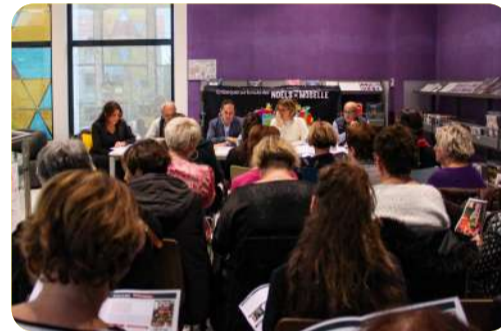
Conférence de presse de Noël