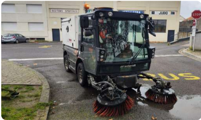
Nettoyage quotidien des rues