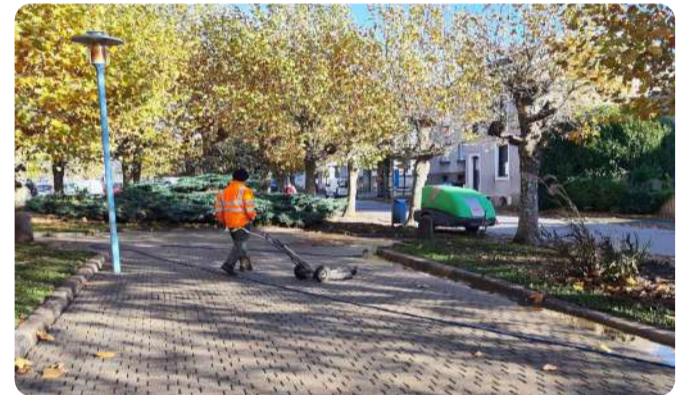
Nettoyage du Monument aux Morts