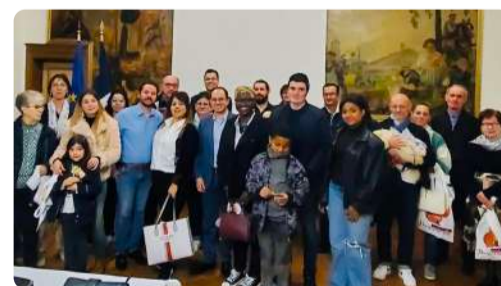
Accueil des nouveaux habitants