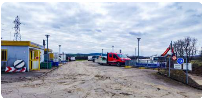
Rénovation de la déchetterie