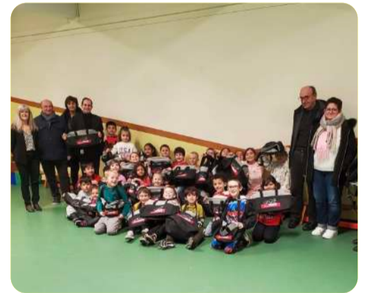
Remise de sacs de sport aux CP de l'école Pol Grandjean