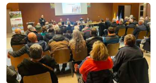
Forum des associations