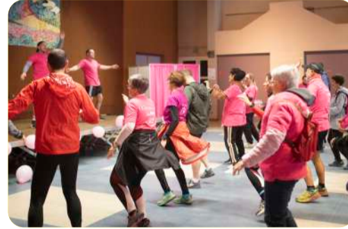
Octobre Rose : la Bouzonvilloise