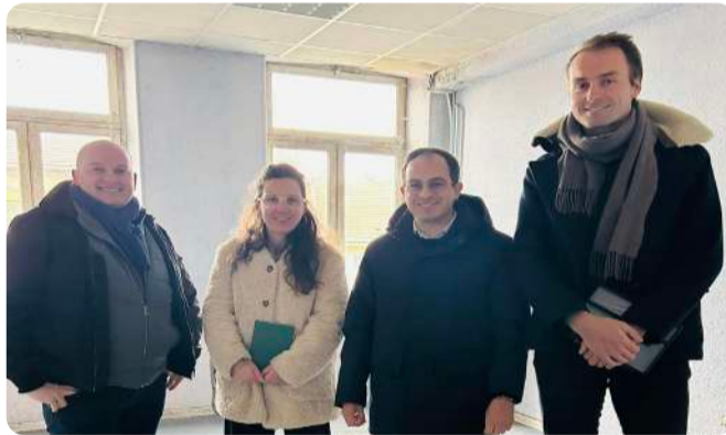
Choix de l'architecte pour le LEP