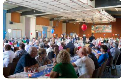
Repas des séniors