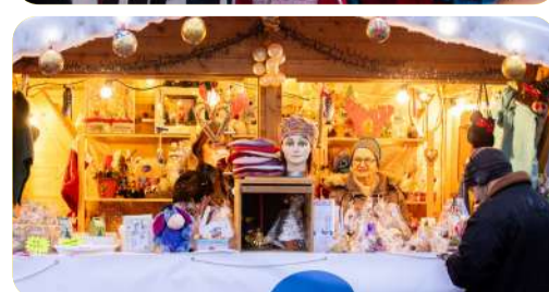
Saint-Nicolas et Marché de Noël