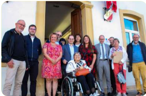
Venue de Ginette Kolinka, survivante du camp d'Auschwitz-Birkenau