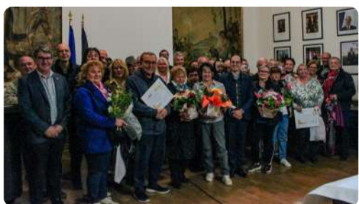
Remise de prix des Maisons Fleuries