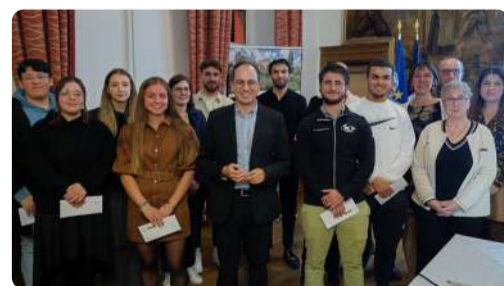
Cérémonie des Méritants et Jeunes diplômés