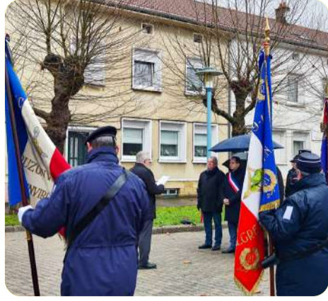
Hommage aux Morts pour la France