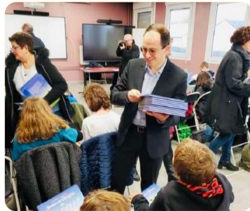
Remise des BD du Département aux élèves du collège Adalbert