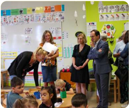
Présence des Elus dans les écoles bouzonvilloises pour la rentrée