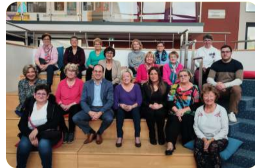
Vernissage de l'exposition de l'Artisanat Récréatif à l'Espace Culturel