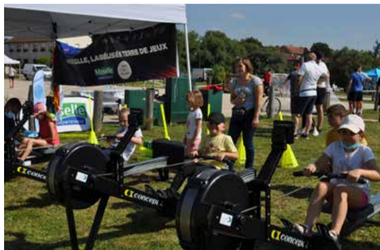
Caravane du sport à Bouzonville, le 25 août dernier.