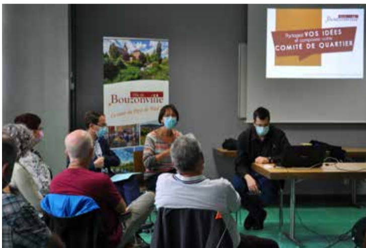
Réunion de lancement des comités de quartier. La commune associe ses concitoyens pour mettre en place et financer des projets collaboratifs et participatifs.