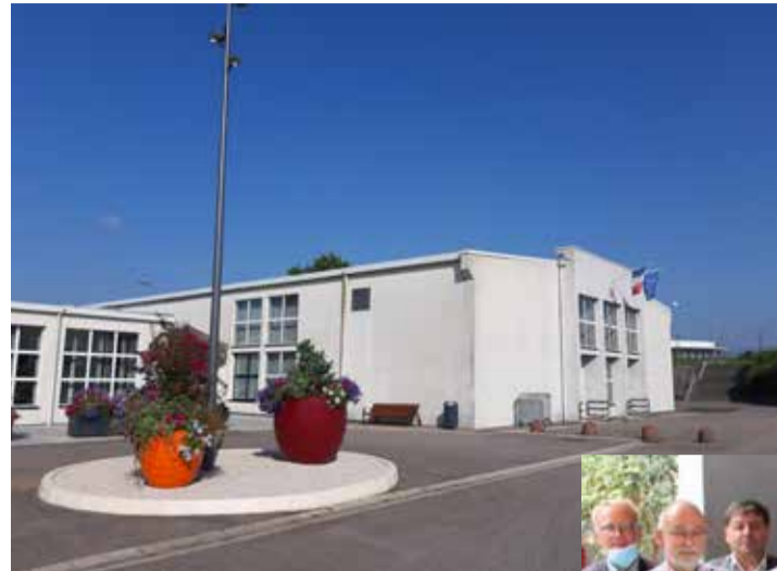
Modernisation du rond point et des abords fleuris du complexe sportif.