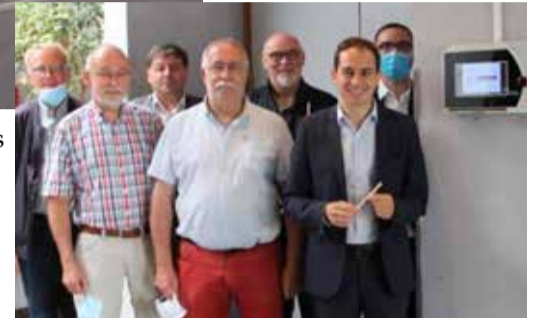
Mise en place d'un éthylotest à la salle des fêtes