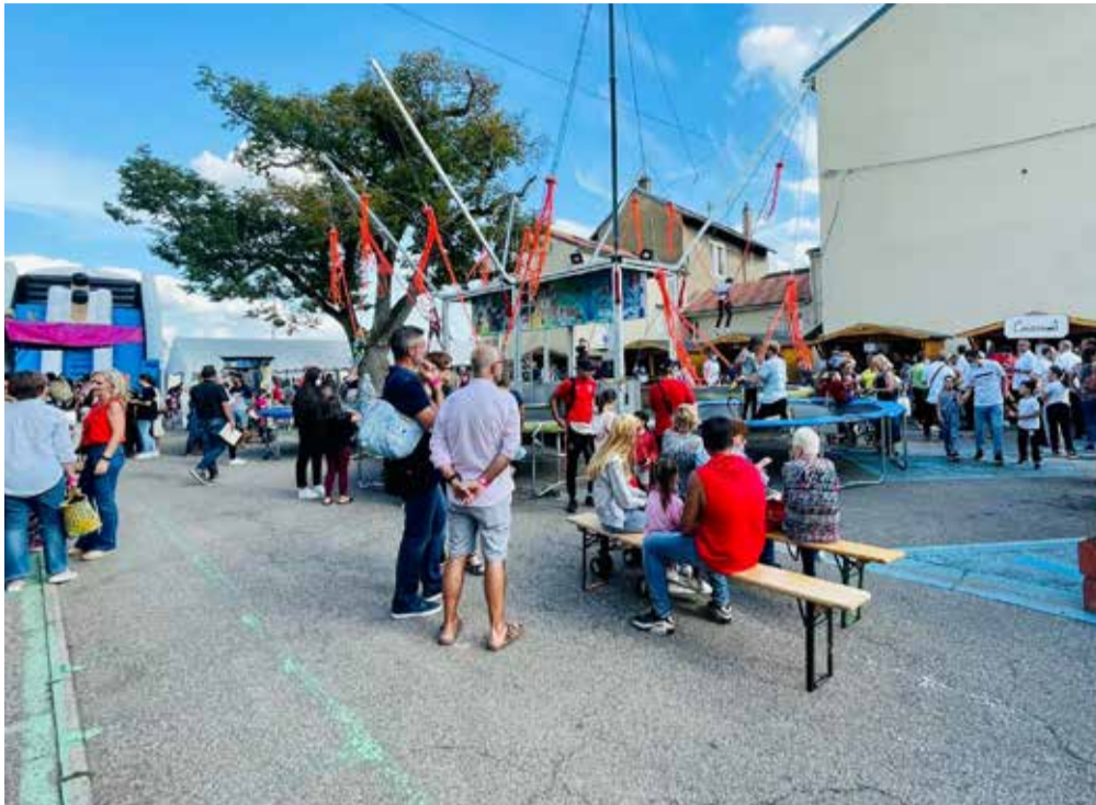
La Kermesse de Bouzonville : samedi 18 et dimanche 19 septembre 2021.