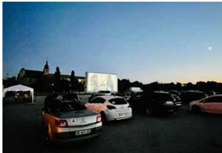
Ciné Drive : cinéma en plein air, le 13 août.