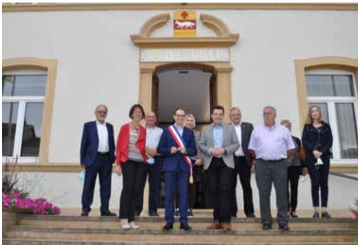
Réunion de travail avec Rehlingen-Siersbourg, le 15 septembre, pour engager le jumelage franco-allemand de demain.