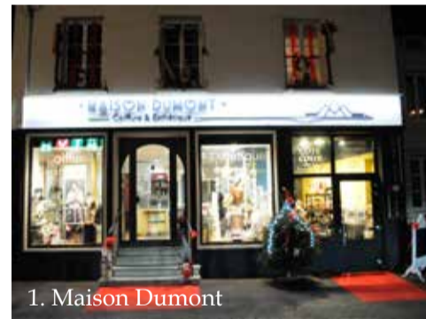
1. Maison Dumont