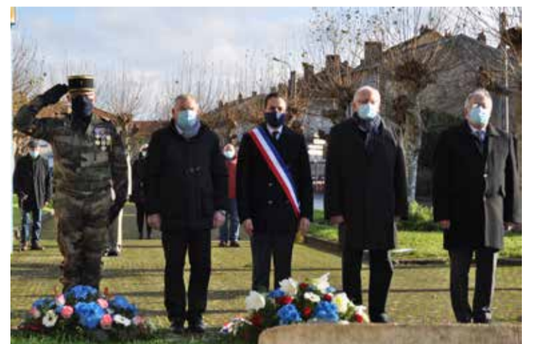
Hommage aux morts pour la France pendant la guerre d'Algérie et les combats du Maroc et de la Tunisie, le samedi 5 décembre 2020.