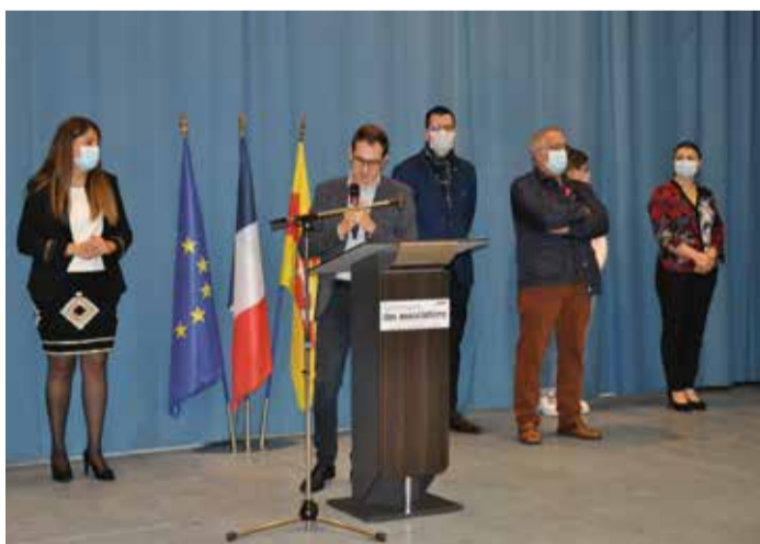
Séminaire des associations le samedi 3 octobre 2020.