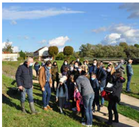
Journée du Développement Durable le samedi 10 octobre 2020.