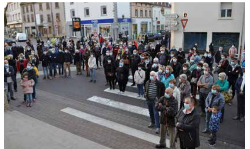
Hommage à Samuel Paty le mercredi 21 octobre 2020.